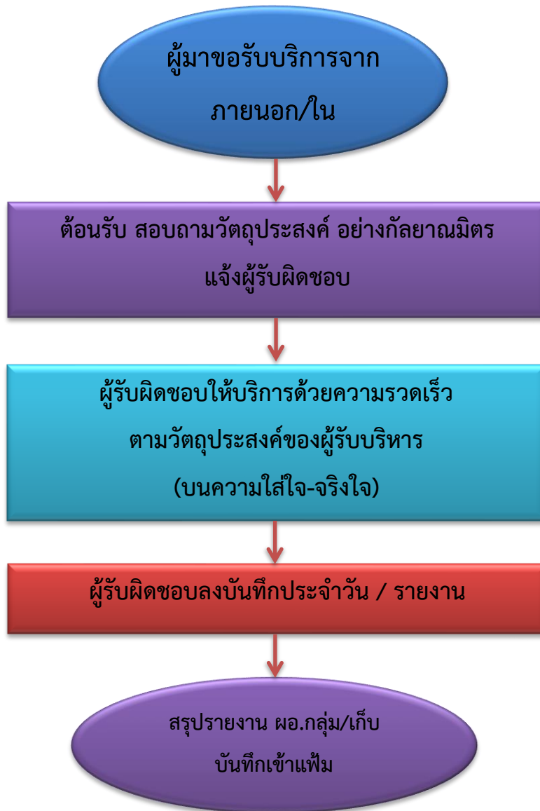
Flow Chart การให้คำปรึกษากับผู้รับบริการ กลุ่มนิเทศ ติดตาม และประเมินผลการจัดการศึกษา